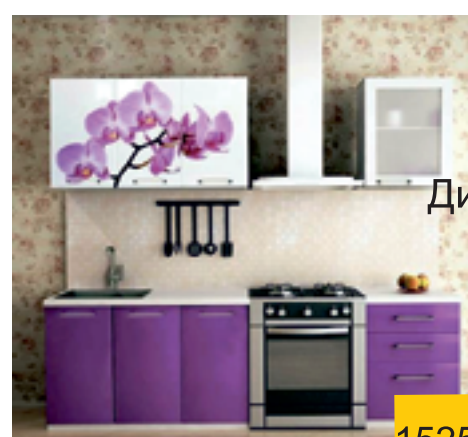
ОРХИДЕЯ кухня 1,6м