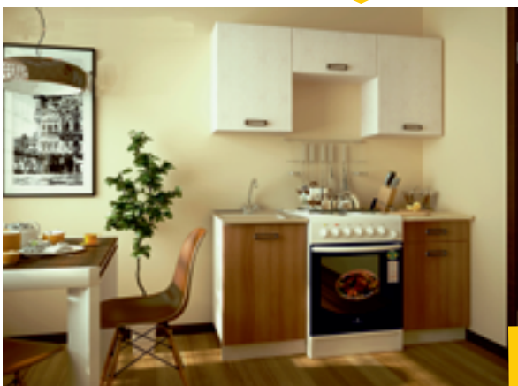
КАТЯ кухня 1.6м