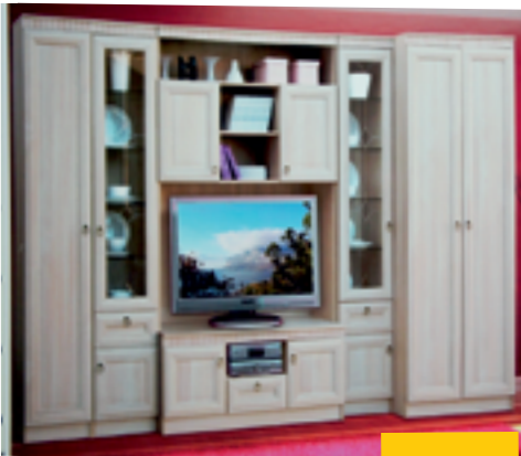
ИННА МОДУЛЬНАЯ СИСТЕМА 3200x468x2248h