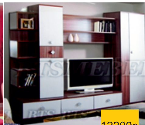
СТИЛЬ МОДУЛЬНАЯ СИСТЕМА 2400x660x1920h