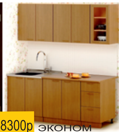
ЭКОНОМ кухня 1.5м