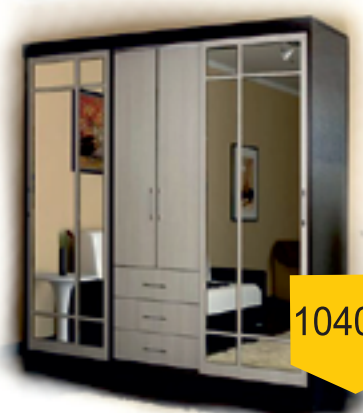
шкаф купе ФОРТУНА