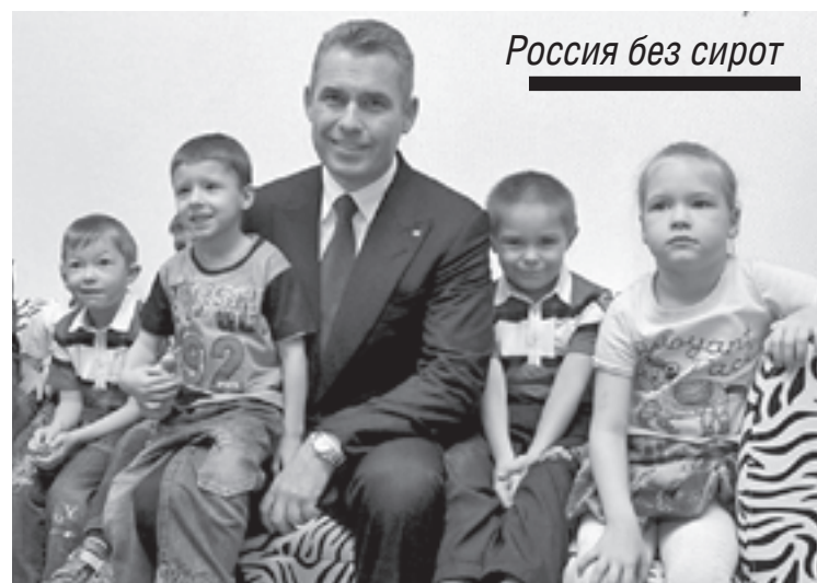
Россия без сирот

По решению А.Г. Тулеева с 1 января 2015 года в Кузбассе вводятся новые льготы для приемных родителей и усыновителей сирот с тяжелым состоянием здоровья. О новых льготах – единовременном соцпособии в 100 тысяч рублей для приемных семей и сертификатах на улучшение жилищных условий для усыновителей – губернатор сообщил на заседании детского общественного совета при региональном уполномоченном по правам ребенка в администрации области. В нем приняли участие уполномоченный при Президенте России по правам ребенка Павел Астахов, члены совета, главы территорий, лидеры молодеж-